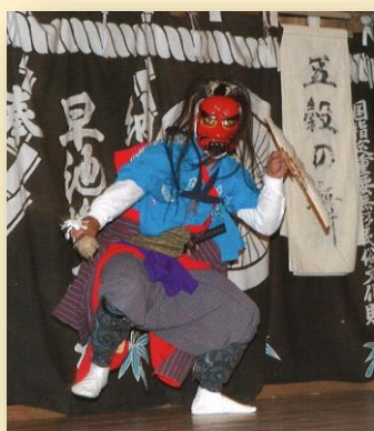
天熊人五穀 （あまくまびとごこく）