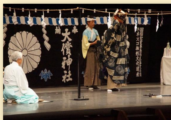
権現舞（ごんげんまい）