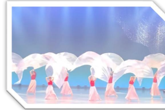
カラーガードチーム arbre (盛岡市)