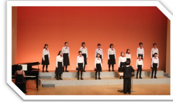
Zホール児童合唱団 (奥州市文化会館)