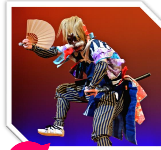
令和4年11月30日 ユネスコ無形文化遺産登録 川西大念佛剣舞 (川西大念佛剣舞保存会)