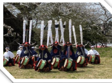
金津流梁川こども獅子躍 (奥州市)