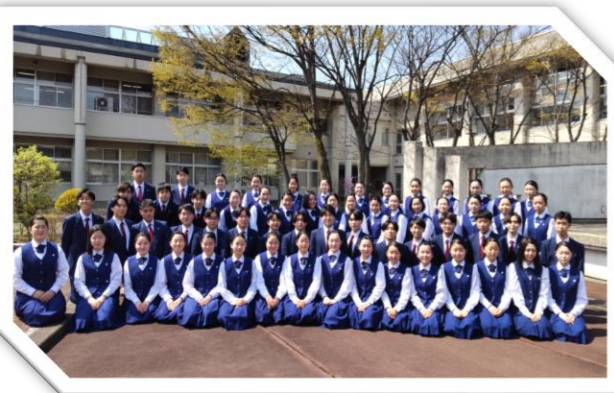
第75回全日本合唱コンクール全国大会高校部門 日本一 岩手県立不來方高等学校音楽部

※新型コロナウイルス感染症の状況などにより出演者・出演順・開催内容は変更になる場合があります。 敬称略。