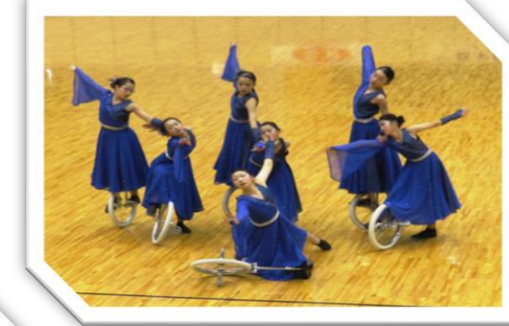
前沢一輪車クラブ アルスノーバ (奥州市)