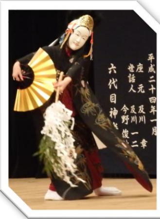
小田代神楽保存会 (奥州市)