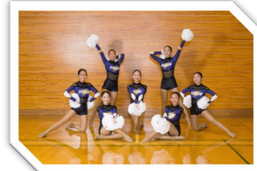
盛岡チアダンスクラブ煌 (盛岡市)